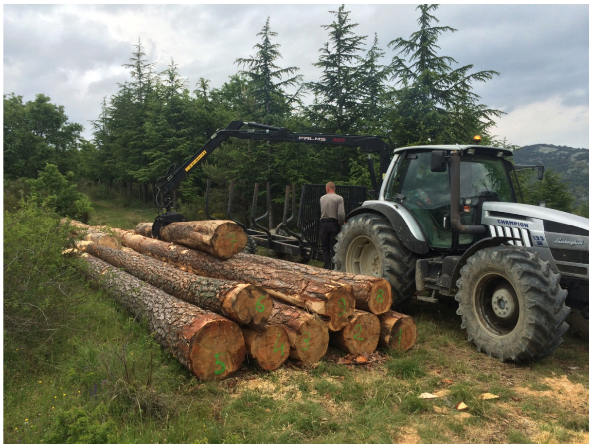
Chargement de bois de pin sylvestre qualité charpente dans le Nord-Est du Var

Gageons que ce type d'initiatives va tendre à se développer pour améliorer les pratiques, la valeur de nos forêts et la culture forestière des citoyens et propriétaires de notre département.