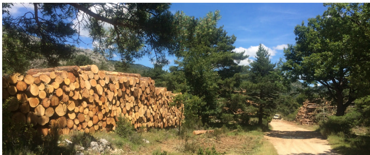
Bois de pin qualité palette (1 er plan) et qualité énergie (second plan) trié sur le même chantier du Nord-Est du Var (commune de Mons) en 2014